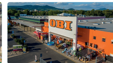
ČESKÁ REPUBLIKA, LITOMĚŘICE

Wault: 4,5 let Pronajímatelná plocha: 4.525 m 2