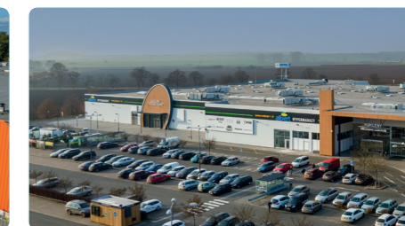
ČESKÁ REPUBLIKA, HRADEC KRÁLOVÉ

Wault: 5,4 let Pronajímatelná plocha: 12.471 m 2