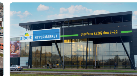
ČESKÁ REPUBLIKA, OSTRAVA

Wault: 5,1 let Pronajímatelná plocha: 13.076 m 2